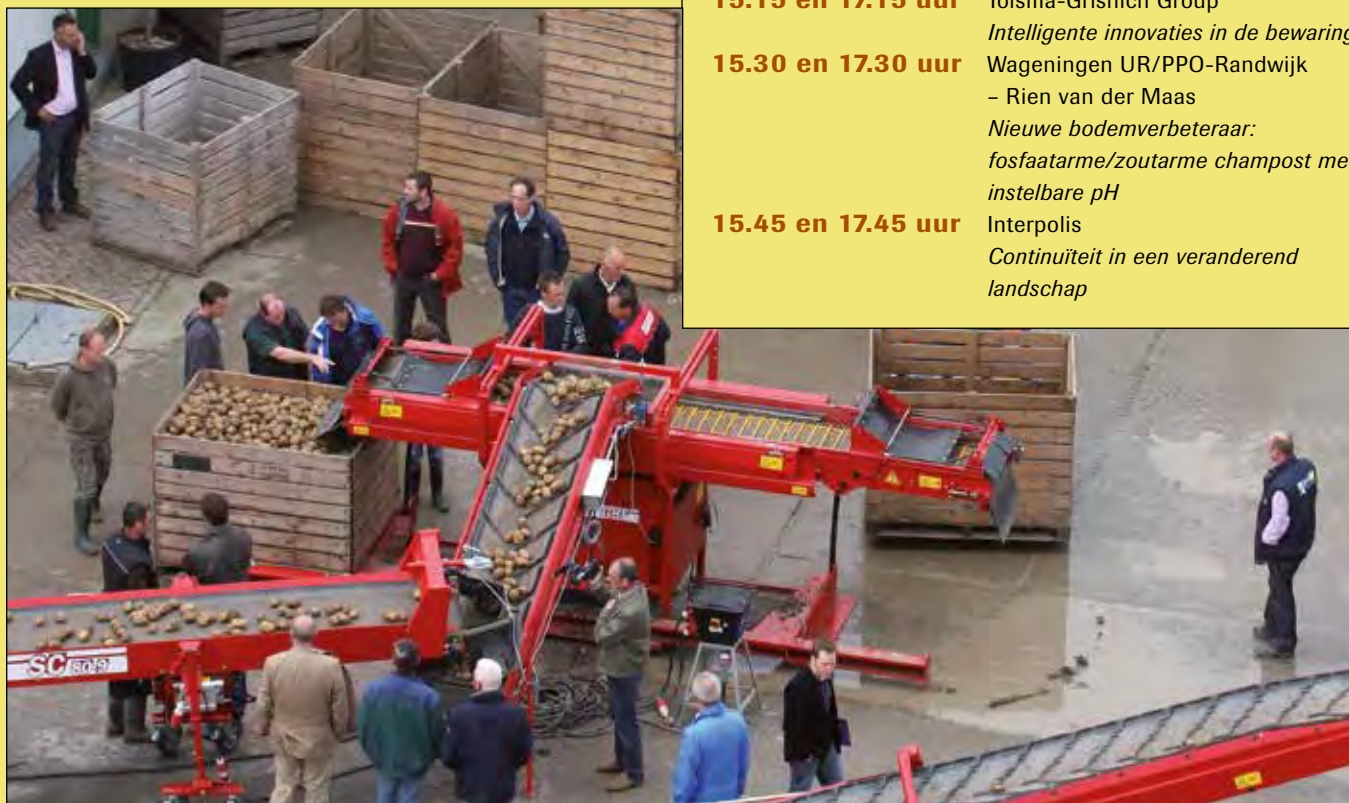
"Vitaliteit, voor een gezonde aardappelsector", is het centrale thema op de beurs.