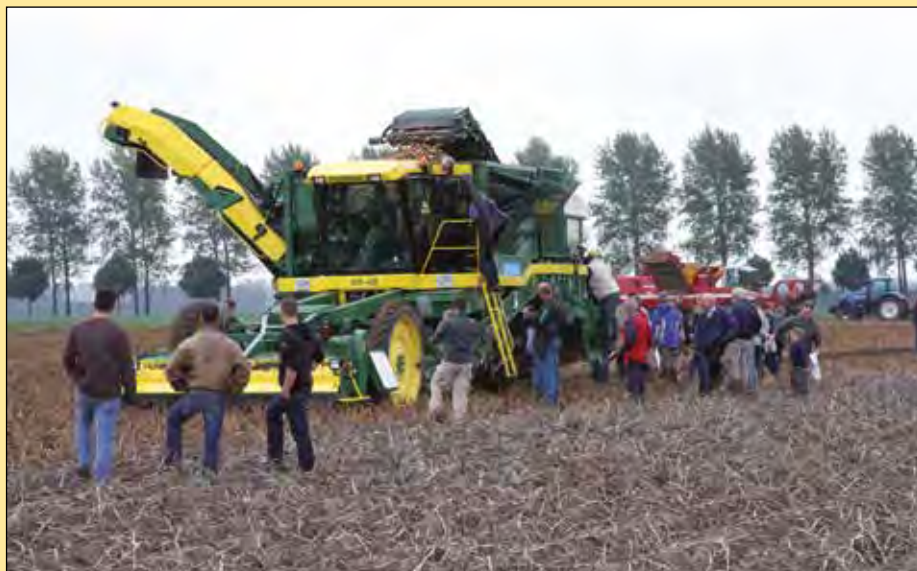
Om al het rooigeweld voldoende ruimte te geven, heeft PPO-Westmaas een perceel van 6 hectare ingeruimd waarop de machines aardappelen van het ras Innovator mogen rooien.

Altijd weer een belangrijke publiekstrekker op de Aardappeldemodag is de uitgebreide rooidemonstratie met daarop volgend het transport en de verladung met alle activiteiten daaromheen. Dit keer hebben zich vier rooierfabrikanten aangemeld. Het gaat om AVR, Dewulf, Ploeger en Grimme. Ze showen het publiek niet alleen maar hele grote rooiers, maar ook boerenmachines als getrokken rooiers. Om al het rooigeweld voldoende ruimte te geven, heeft PPO-Westmaas een perceel van 6 hectare ingeruimd waarop de machines aardappelen van het ras Innovator mogen rooien. Altijd indrukwekkend is het om te zien hoe de verschillende technieken omgaan met de weers- en bodemomstandigheden van het moment. Het perceel met Innovator betreft relatief zware vruchtbare kleigrond. Tijdens het groeiseizoen hebben de aardappelen behoorlijk veel last gehad van neerslag. Daarvan heeft het gewas flink te lijden gehad, laat Tramper weten. "De grond in de ruggen is flink dichtgeslagen en de planten