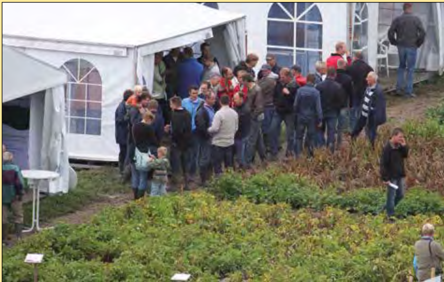
Nedato noemt de velddemo Aardappelteelt 2.0, wat duidt op een nieuwe en toekomstgerichte wijze van aardappels telen.

Aardappelcoöperatie Nedato uit Oud-Beijerland heeft in het demoveld geëxperimenteerd met plantversterkende middelen, bacteriepreparaten en alternatieve methoden van bemesting. Hiervoor zijn aparte proeven aangelegd. Bij elke proef gaan vertegenwoordigers uitleg geven over het hoe en waarom van de toepassing en de resultaten. Nedato noemt de velddemo Aardappelteelt 2.0, wat duidt op een nieuwe en toekomstgerichte wijze van aardappels telen. Meer informatie hierover is door de coöperatie nog niet bekendgemaakt. Dat maakt nu al extra nieuwsgierig naar de eindresultaten.