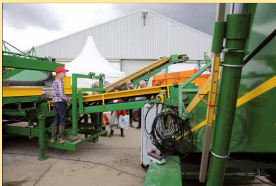
Machinebouwer Prinsen Handling solutions uit Emmeloord zal op de Aardappeldemodag de allernieuwste Visser-stortbak van het type AL 2400 presenteren.

ren zijn uitgevoerd met een klembussysteem, waardoor ze gemakkelijk uit te wisselen zijn. Verder zijn de onderhoudsvrije rollenreinigers elektrisch verstelbaar en de openingsafstanden lopen uiteen van 8 tot 65 millimeter. Eveneens opvallend is de nieuwe rollenreiniger die vrij is van kokers onder de rollen, waardoor een optimaal reinigingseffect ontstaat. De rollenreiniger is leverbaar met verschillende roltypes zoals een polyurethaan spiraalrol, een veerstaal spiraalrol en een gladde rvs buisrol met afschraper. De polyurethaanrollen zijn optioneel uit te voeren met een high-speed cleaning-systeem voor de rollen.