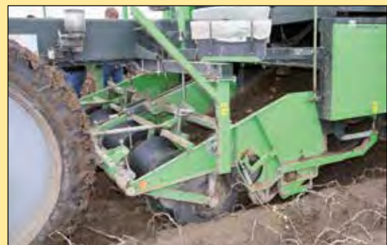
Oogstseizoen 2017 zal AVR een compleet nieuwe rooibek voor al haar rooimachines introduceren.

aangedreven rooischijven. De diepteregeling vindt plaats met hulp van twee hoekopnemers die de bewegingen van de twee sleepvoeten volgen. Bij de ACC blijven de diabolo's wel in functie doordat ze de opgetilde rug net iets tegenhouden. Ze breken dus wel de bovenkant van de rug (de korst), maar drukken de rug niet aan/in. Verder is het gewoon mogelijk te blijven rooien met hulp van de automatische diepteregeling.