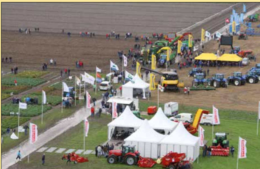
Enkele deelnemers pakken extra groot uit op het mechanisatiepark, zoals demodagsponsor Grimme met een eigen machineplein.

Langs het kavelpad dat de opgang naar het terrein met rooidemonstraties vormt, is een compleet mechanisatiepark opgezet. Hier tonen verschillende fabrikanten en landbouwmechanisatiebedrijven de all-laatste stand van zaken omtrent technieken voor de aardappelteelt. Een enkeling pakt extra groot uit, zoals demodagsponsor Grimme. De Duitse fabrikant van landbouwwerktuigen heeft een compleet plein ingericht waar nog een groot aantal moderne machines staan die niet meedoen aan de live-demonstraties op het veld en erf. ●