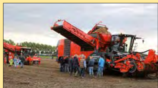
Opmerkelijk is de uitgekende gewichtsverdeling van de Kwatro.

les, aldus Dewulf. Tevens is het een rooier met de grootste bunker op de markt met een inhoud van maar liefst 17,5 kuub. Het zeeftraject van Kwatro bestaat uit een opeenvolging van een korte graafmat en twee zeefkettingen zonder vernauwingen. Dankzij deze brede en onbelemmerde doorstroming heeft de rooier een maximale zeefcapaciteit. Na het zeven komt de productstroom terecht op een egelband die een eerste intensieve reiniging voorziet. Daarna komen de aardappelen op de reinigungsmodule Flexyclean. Hierna verdelen de aardappelen zich over de volledige breedte van de ringelevator dankzij een 3-delige verdeelband. De ringelevator is uitgerust met actieve zijwanden die de aardappelen beschermen tegen beschadiging. Boven op de rooier is het mogelijk om in de afvoerband een