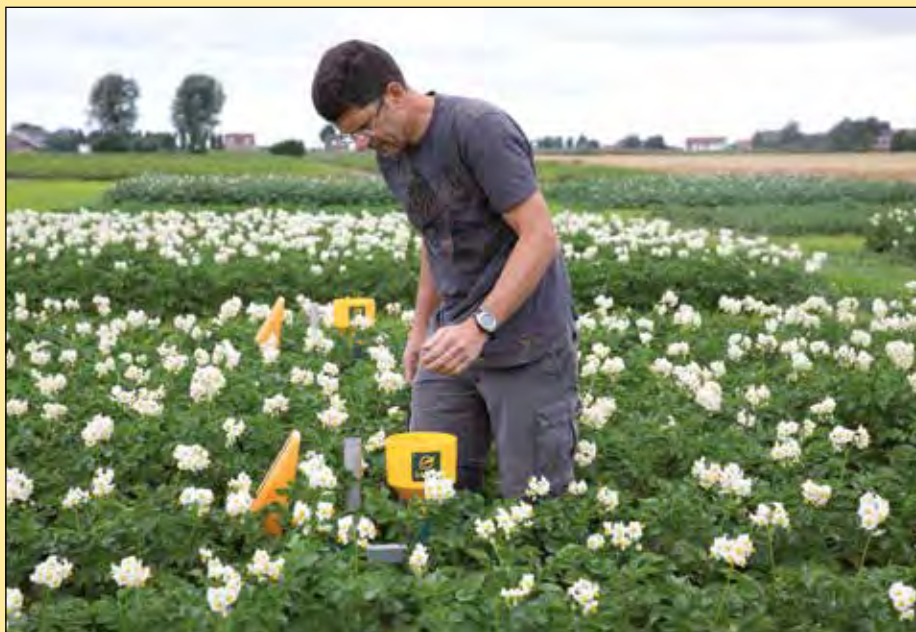
Met meetapparatuur van Dacom is in het demoveld met Zeba gedurende het groeiseizoen de vochttoestand in de ruggen gemeten.

gebleken. Bij prijzen als die van Oogst 2015 gaat het al snel om een extra opbrengst die tussen 350 en 750 euro per hectare ligt. Met meetapparatuur van Dacom is gedurende het groeiseizoen de vochttoestand in de ruggen gemeten.