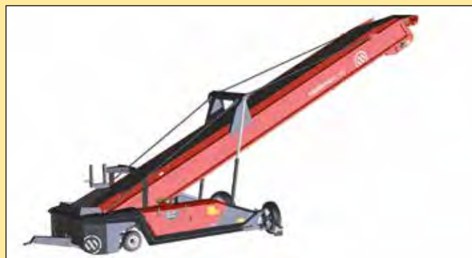
De ML-reeks van Miedema kenmerkt zich door modern design.

De gloednieuwe ML-reeks kenmerkt zich door een modern design en maakt gebruik van de nieuwste technologieën. De 80 centimeter brede band met diepe trog heeft een hoge capaciteit van meer dan 150 ton per uur. Dit combineert de ML met een productvriendelijke transportbandsnelheid. De brede transportband ligt in het geheel vrij van het frame, waardoor deze voor de volle 100 procent te benutten is. Daardoor blijft de kwaliteit van het te transporteren product maximaal gegarandeerd, aldus de fabrikant. Het uiteinde van de transporteur is knikbaar, waardoor een nauwkeurig vulwerk met beperkte valhoogte mogelijk is. De hallenvullers zijn verkrijgbaar in lengtes van 16, 19 of 22 meter. Verder zijn ze volledig klantgericht samen te stellen door middel van drie vulprogramma's: Farmer, Comfort en Dynamic.