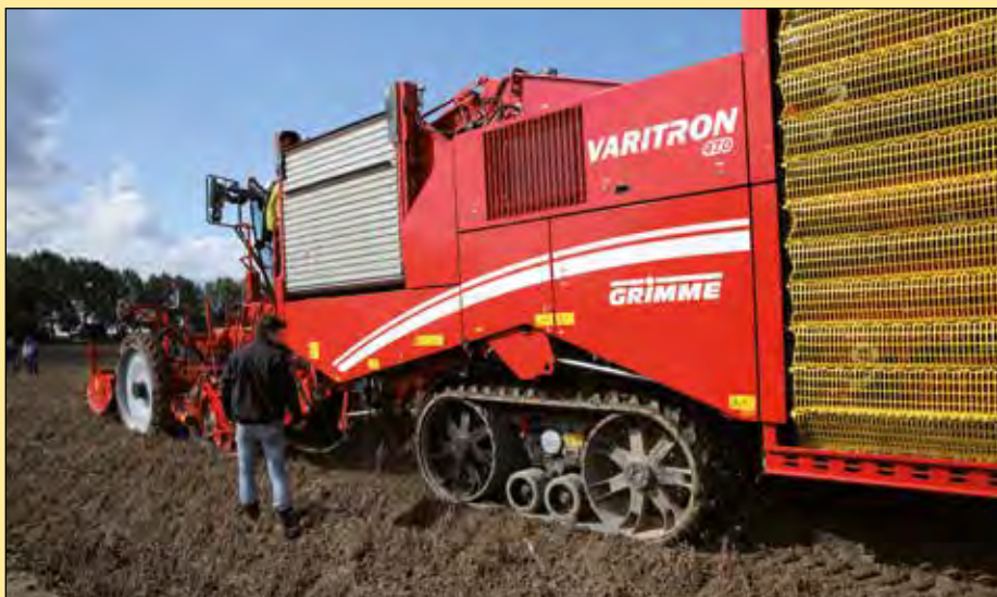
Als zelfrijder is de nieuwe Varitron 470 met Terratrac rupsaandrijving present op de demodag.

Grimme is tijdens de Aardappeldemodag prominent aanwezig met twee rooimachines.