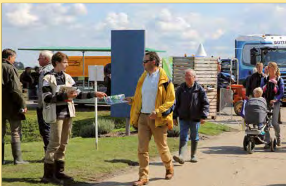
De unieke samenwerking tussen Aardappelwereld magazine en de Aardappeldemodag krijgt voor alle bezoekers al sinds de eerste editie van het topevenement duidelijk gestalte wanneer zij gratis de speciale cataloguseditie van het vakblad ontvangen.

Aardappelwereld magazine is, zolang de Aardappeldemodag bestaat, zeer nauw betrokken bij de organisatie van het evenement. De unieke samenwerking krijgt voor alle bezoekers al sinds de eerste editie van het topevenement duidelijk gestalte wanneer zij gratis de speciale cataloguseditie van het vakblad ontvangen. Ook de aankomende editie van de Aardappeldemodag krijgen alle bezoekers bij de hoofdingang een gratis exemplaar van het augustusnummer uitgereikt met daarin opgenomen de complete beurscatalogus.