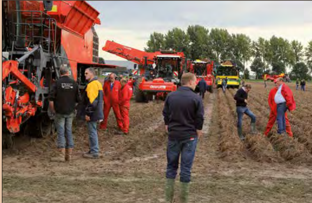
Rooiers vormen op de Aardappeldemodag altijd het middelpunt van de belangstelling.

Rooiers vormen op de Aardappel-demodag altijd het middelpunt van de belangstelling. Vooral omdat je van dichtbij hun werking in de alledaagse praktijk kunt bewonderen. Tot voor kort ging alle belangstelling nog uit naar groot, groter, grootst. Inmiddels is dit wat aan het veranderen. Veel aardappeltelers nemen in toenemende mate maatregelen om bodemverdichting te voorkomen. Door klimaatverandering die meer neerslag in een korte periode geeft, zijn de momenten waarop de grond in de oogstperiode goed berijdbaar is soms erg beperkt. Vandaar dat lichtere zelfrijders en ook getrokken rooiers weer volop in de schijnwerpers staan. Ook op het rooiedemoveld in Westmaas zullen hiervan volop voorbeelden te zien zijn van de merken AVR, Dewulf, Ploeger en Grimme.