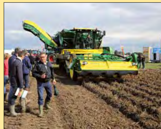
Ploeger komt met het model AR 4BX naar het demoterrein te Westmaas. Nieuw aan de rooier is de kleurstelling, meer geel, minder groen. Op de foto is het nog andersom.

camera's. Wat Ploeger verder nog kan melden is dat de rooier een doordachte constructie heeft waarbij alle zeefmatten dezelfde breedte hebben, zodat de productstroom zonder haperingen of capaciteitsverlies kan plaatsvinden. De nieuwe bunker heeft een inhoud van 14 ton en valt daarmee onder de categorie middenzwaar. Volgens de fabrikant is de opvoerelevatorsak uniek. Dankzij de grote inhoud per elevatorsak kan het de aardappelen productvriendelijk/schadevrij naar de bunker vulband transporteren. Verdeelbanden dragen zorg voor een minimale valhoogte vanuit de opvoerelevatorsak naar de bunker vulband.