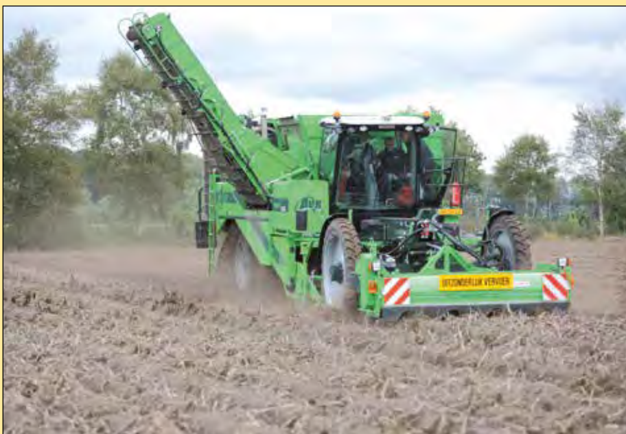
De Puma 3 is twee jaar geleden al helemaal ingericht op 'aandacht voor de bodem'.

Machinefabrikant AVR uit het Belgische Roeselare komt met de vierrijige AVR Puma 3 naar Westmaas. Deze rooier is twee jaar geleden al helemaal ingericht op 'aandacht voor de bodem'. Zo hebben constructeurs van de rooier kans gezien het gewicht beperkt te houden tot een maximum van 23.500 kilogram. Verder is de rooier uitgerust met extra brede en ook flexibele achterbanden. Het gaat dan om 90 centimeter brede increased flexibility banden van Mitas. Deze zijn speciaal ontworpen voor rooiers met een cyclische (wisselende) belasting, laat AVR weten. Dat houdt in dat de druk in de banden optimaal is bij zowel een volle als lege bunker.