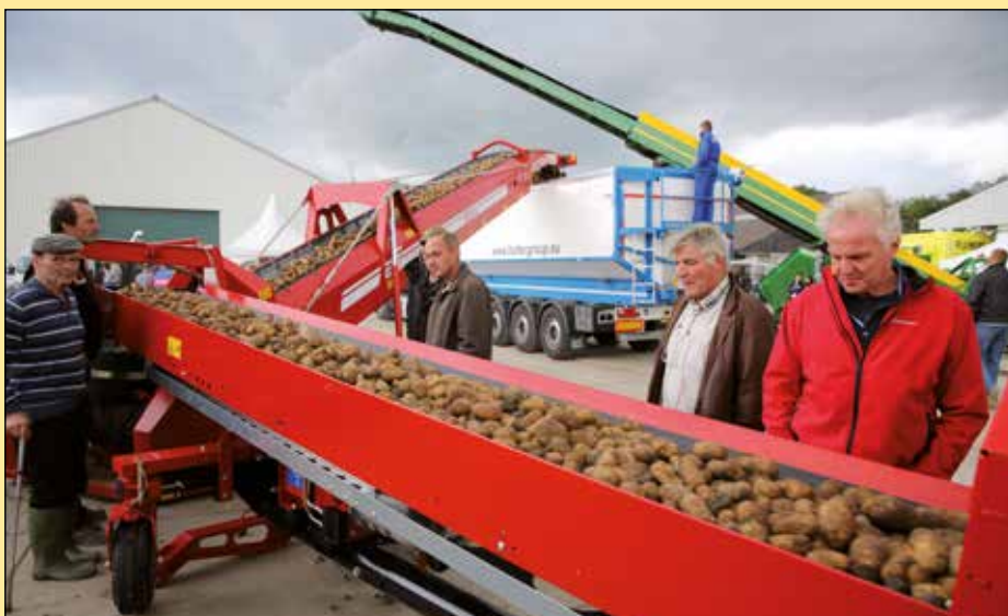
Grimme toont een duoband met airbag-landing.

hier de meeste schade oplopen in het hele rooi- en inschuurtraject. Dit doordat een deel van de productstroom precies op de harde steunrollen stuitert die onder de band zijn bevestigd. Wat de overige techniek aangaat, is de Grimme-duoband van alle