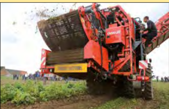
De Flexyclean reinigungsunit betreft een gepatenteerd variabel bypasssysteem in combinatie met axiaalrollen.

Roويمachinefabrikant Dewulf uit het Belgische Roeselare is op de Aardappeldemodag present met de allernieuwste uitvoering van de 2-rijige zelfrijdende zeefbandrooier van het type RF 3060. Dankzij de modulaire bouw is de rooier beschikbaar in maar liefst negen verschillende uitvoeringen. Het model dat Dewulf mee zal brengen is voorzien van een Flexyclean reinigungsunit. Dit betreft een gepatenteerd variabel bypasssysteem in combinatie met axiaalrollen. Hiermee is de reiniging van de aardappelstroom traploos in te stellen en handig aan te