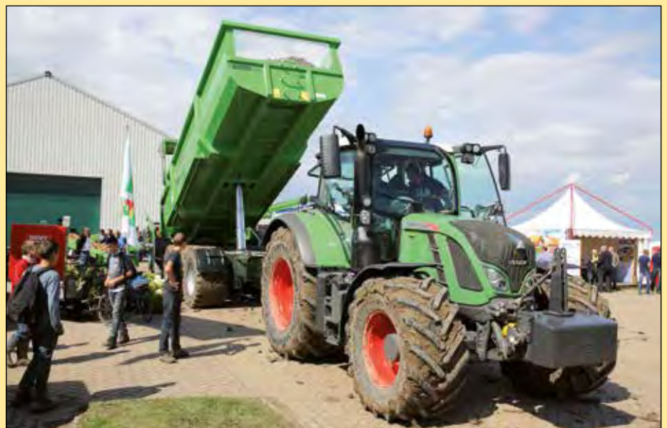
Op het hoofdterrein tijdens deze editie van de Aardappeldemodag is wederom een volledig aaneengesloten logistiek traject van rooien tot en met verladen te zien.

Op het hoofdterrein tijdens deze editie van de Aardappeldemodag is wederom een volledig aaneengesloten logistiek traject van rooien tot en met verladen te zien. De bedrijvenmarkt binnen, de stands en mechanisatiepark buiten, de oogstdemonstratie, loslijnen en transport; de hele route sluit naadloos op elkaar aan. Diverse transportcombinaties van trekkers met kippers brengen de aardappels naar een van de vier loslijnen die de geogste Innovator in onderlossers draaien. Het gaat hier om de nieuwste loslijnen van Prinsen Handling solutions, Grimme, Dewulf Miedema en AVR. ●