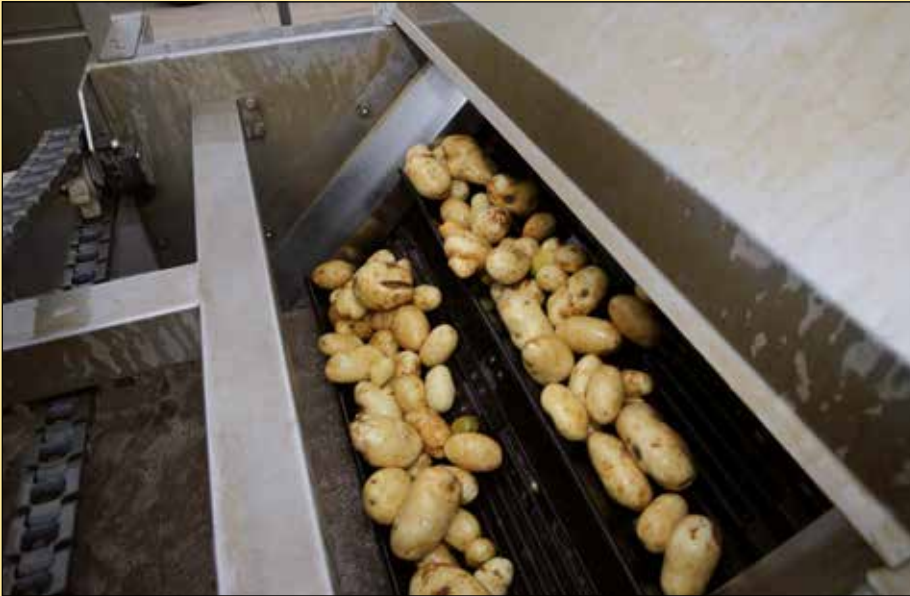
Het gehele verwerkingsproces van aardappels wassen tot en met verpakken komt aan bod op het Holland Process Paviljoen.

ne die elke onrechtmatigheid uit de aardappelen haalt. Sarco Packaging, leveran-