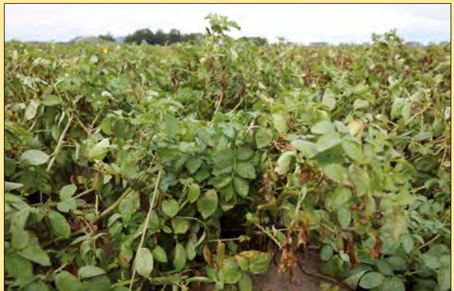
In het middel Narita zijn tot nu toe geen problemen met resistentie gevonden als het gaat om Alternaria.

Evenals op de eigen proefvelddag van Belchim in Londerzeel richt de Belgische fabrikant van gewasbeschermingsmiddelen zich op de Aardappeldemodag op de aanpak van de ziekten Phytophthora en Alternaria, waarbij Alternaria extra veel aandacht krijgt. De aardappelsector heeft zich tot op heden namelijk nooit druk gemaakt over resistentie management bij de bestrijding van Alternaria, meent Belchim. De ziekte was tot op heden met de beschikbare middelen goed onder controle te houden. Inmiddels is dat anders, doordat onlangs resistentie gevonden is tegen een groep van de strobilurines, een werkzame stof in sommige middelen. Daardoor neemt de vraag naar een goed resistentie management en extra kennis sterk toe. De reden dat Belchim veel nadruk legt op het onder controle houden van Alternaria ligt in het feit dat het bedrijf het middel Narita levert waar tot nu toe geen problemen met resistentie zijn gevonden. Uit onderzoek van Belchim is onder meer gebleken dat het belangrijk is om af te wisselen met werkzame stoffen. Ook uit proeven die Belchim op de proefboerderij in Westmaas heeft uitgevoerd, komt naar voren dat de resistenties toenemen. Dat